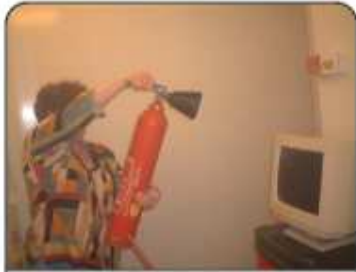
Exercice sur feu simulé (d'origine électrique) avec extincteur CO 2 .