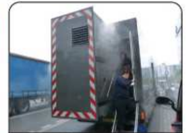
Exercice d'évacuation dans une fumée propre et sans danger.