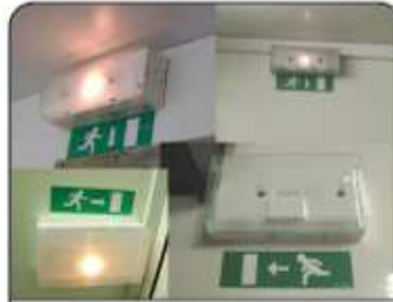
Balise des sorties de secours.