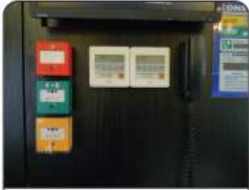
Téléphone et déclencheurs manuels.