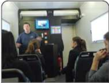
Salle de cours climatisée et conviviale avec équipement vidéo informatique.