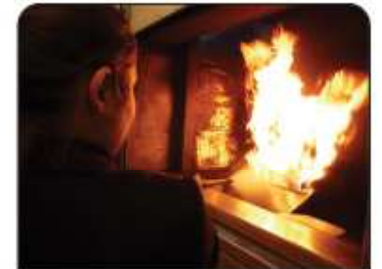
Exercice sur feu propre et réel de classe A, B ou C avec des extincteurs pédagogiques.