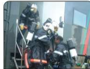
Exercice de Sécurité Incendie sous Protection Respiratoire Isolant.