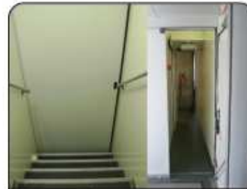
Plusieurs scénarios d'évacuation possibles avec un parcours modulable.